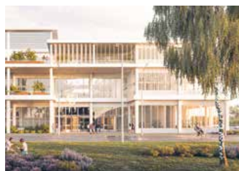
Implanté sur le campus de Polytechnique, le bâtiment du centre d'innovation et de recherche de Total à Saclay répondra à des critères de haute performance environnementale et a été conçu pour tester, grandeur nature, les technologies du groupe en matière de systèmes énergétiques et de mobilité.

Le groupe, qui emploie quelque 1 400 chercheurs dans dix-huit centres de R&D à travers le monde et collabore avec un millier de partenaires académiques, est présent depuis 2007 sur le territoire de Paris-Saclay, où ses équipes ont intégré en 2013 l'Institut photovoltaïque d'Île-de-France.